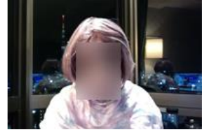
特別出演(?) いただいた「鶴丸。ママ」

※当日のご挨拶では、「鶴丸。ママ」の衝撃的な演出に参加者のみなさん大爆笑でした！